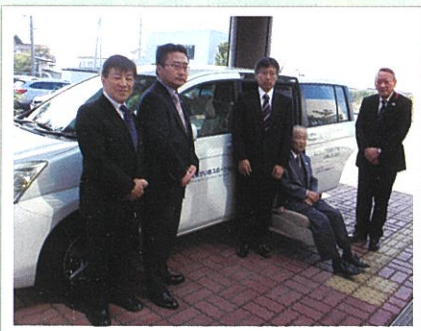
車両贈呈式(車両:トヨタ アイリス) 車いすの方が電動で乗降できる福祉車両。