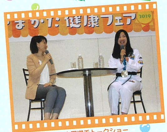
太田選手トークショー