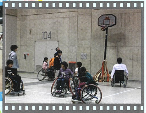
車いすバスケットボール体験